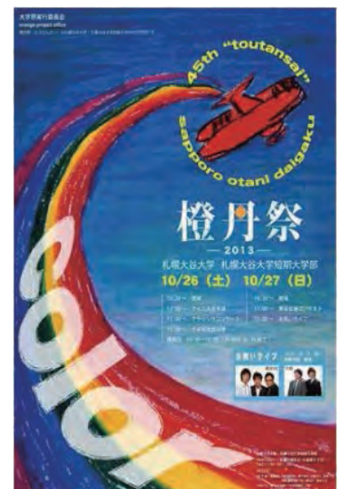
← 美術学科生デザインの橙丹祭ポスター

ココイク? vol.2は、札幌大谷大学社会学部1年生3名・2年生6名の計8名で編集作業を行いました。昨年1月に発行したvol.1に引き続いてご協力いただきました、シヨッピングセンター光星の皆様にはこの場をお借りして感謝申し上げます。今回も多くのの方々手に届けばいいなと一同願っています!